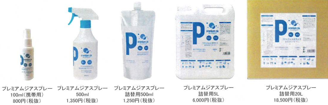
プレミアムジラスプレー 100ml(携帯用) 800円(税抜) | プレミアムジラスプレー 500ml 1,350円(税抜) | プレミアムジラスプレー 詰替用500ml 1,250円(税抜) | プレミアムジラスプレー 詰替用5L 6,000円(税抜) | プレミアムジラスプレー 詰替用20L 18,500円(税抜)