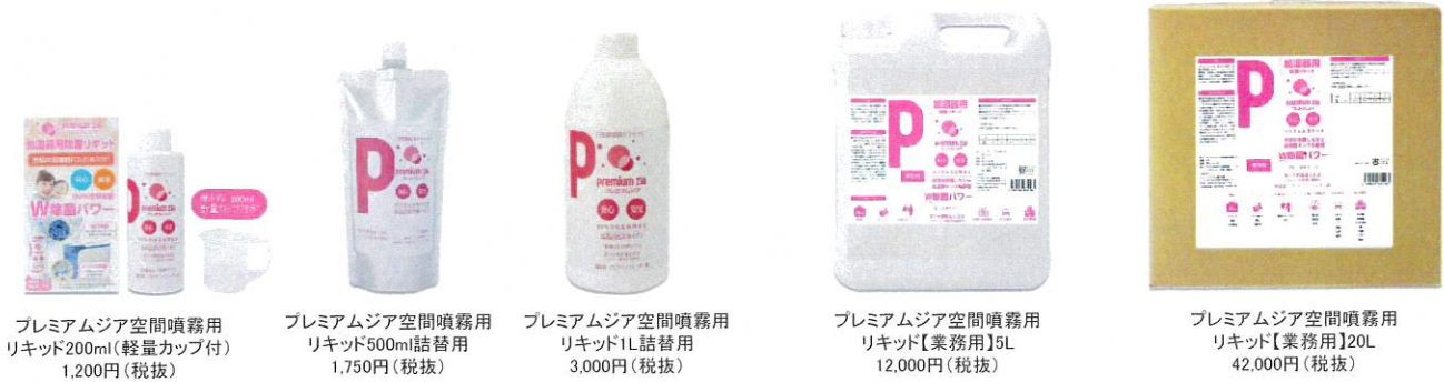
プレミアムジア空間噴霧用リキッド200ml(軽量カップ付) 1,200円(税抜) | プレミアムジア空間噴霧用リキッド500ml詰替用 1,750円(税抜) | プレミアムジア空間噴霧用リキッド1L詰替用 3,000円(税抜) | プレミアムジア空間噴霧用リキッド【業務用】15L 12,000円(税抜) | プレミアムジア空間噴霧用リキッド【業務用】20L 42,000円(税抜)